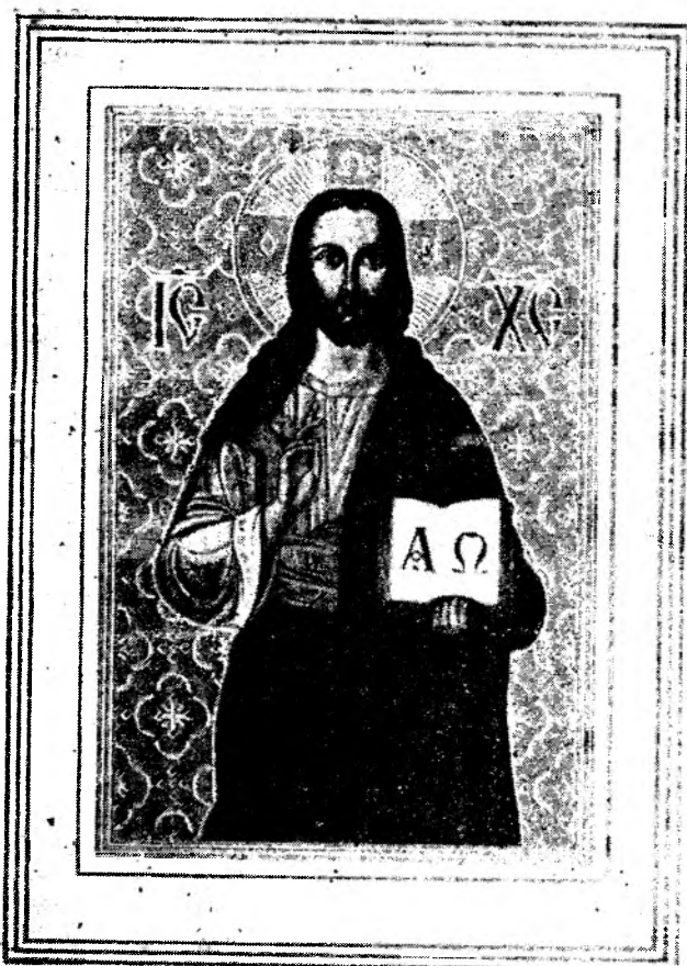
Sviatok Mena Ježiš (Obrezanie)

Náš obrad predpisuje v posledný deň starého roku večer bohoslužbu akafistu Ježišovi Kristovi s ekténiou vďaky a vzývania pomoci Svätého Ducha. Zúčastníme sa na tejto bohoslužbe vďaky za starý rok a vzývania pomoci Svätého Ducha na nový rok, a tak, s menom Ježiša Krista na ústach kráčajme do nového roku! Vtedy bude pre nás požehnaným.